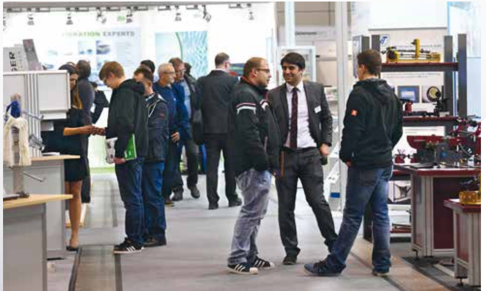
Stand: August 2017 · Änderungen vorbehalten