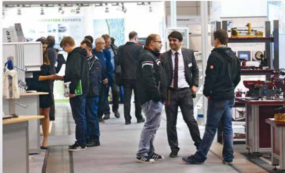
Stand: August 2017 · Änderungen vorbehalten