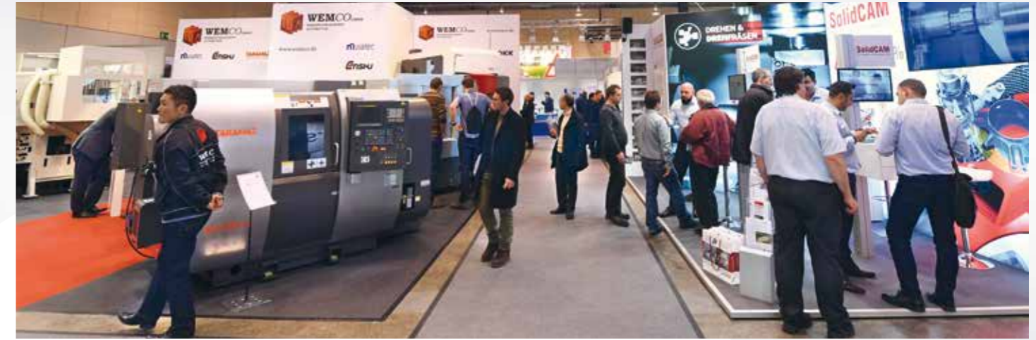
Branchentreffpunkt DST Südwest: Information und Innovation konzentriert an einem Ort.

Die Messe für Zerspanungstechnik VS-Schwenningen