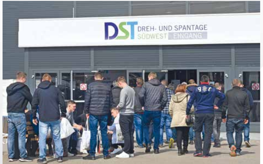
Fotos: Kienzler, Sigwart, SMA – Stand: Juli 2019 · Änderungen vorbehalten