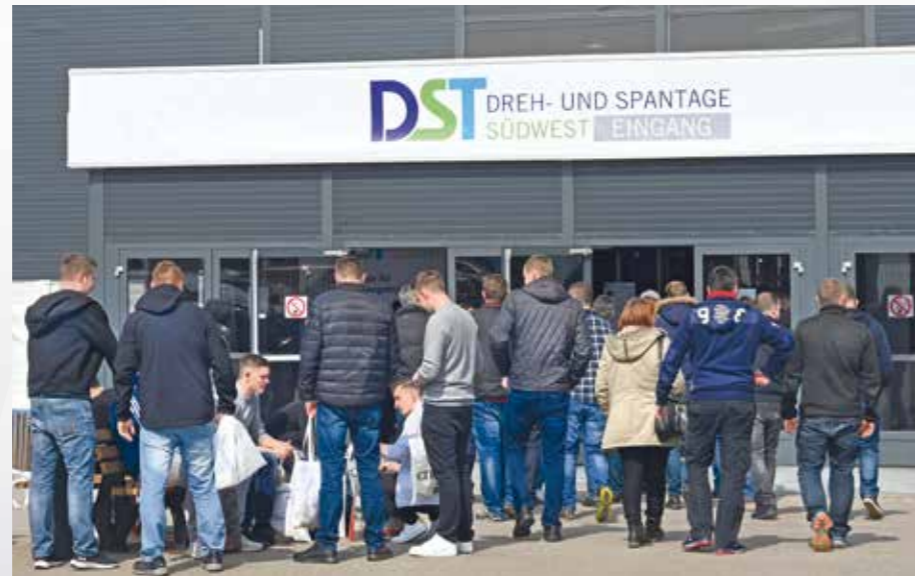
Stand: Juli 2019 · Änderungen vorbehalten